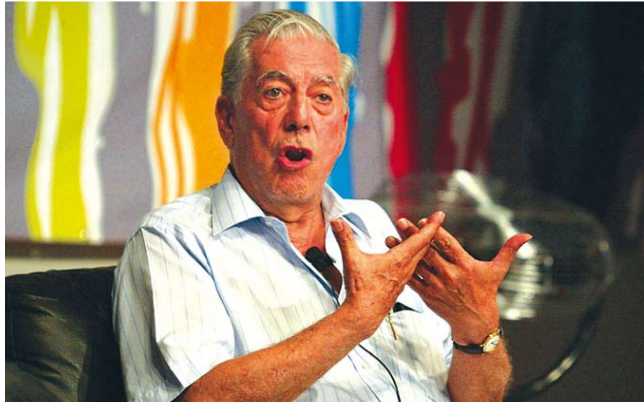
Mario Vargas Llosa: "Mucha gente ha dado el paso de apoyar a Humala, tranquilizados con las manifestaciones que ha dado de haber centrado su propuesta".