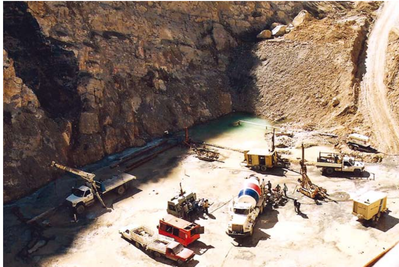
El Estado debe promover la economía dejando su rol subsidiario. La actual correlación de fuerzas permite introducir reformas al neoliberalismo radical.

Lo primero que debemos saber es de donde emana el principio de subsidiariedad.