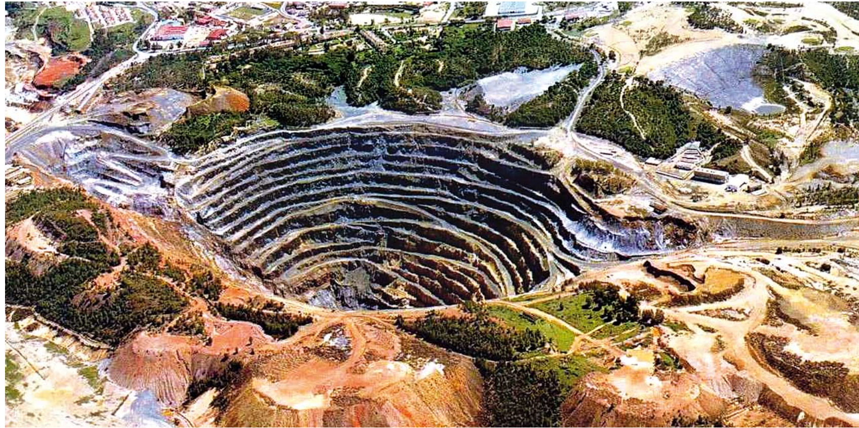
Las empresas mineras en Perú son un caso típico de injusticia tributaria. Mediante exenciones injustificadas y otros mecanismos dejan de pagar millones de soles en impuestos.

Sin embargo, ésta no es la realidad que vivimos en la región. América Latina enfrenta grandes dificultades para aumentar el peso de los impuestos