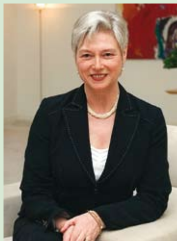
María van der Hoeven, directora de la AIE.

Para alcanzar el objetivo de que las personas con menores recursos tengan acceso a la energía eléctrica en el año 2030 sólo se requiere una inversión de 36,000 millones de euros por año, sólo el tres por ciento del monto total que se invierte