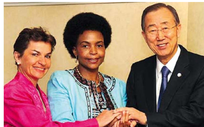
Christiana Figueres, Maite Nkoana-Mashabane y Ban Ki-moon en la conferencia de Durban.

En la sesión plenaria de clausura del 11 de diciembre, la ministra de Medio Ambiente de India, Jayanthi Natarajan, defendió con vehemencia la oposición de su país a comprometerse a un protocolo jurídicamente vinculante,