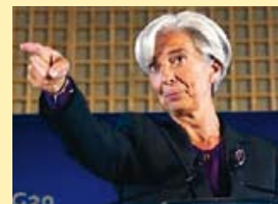
Christine Lagarde, directora del FMI.