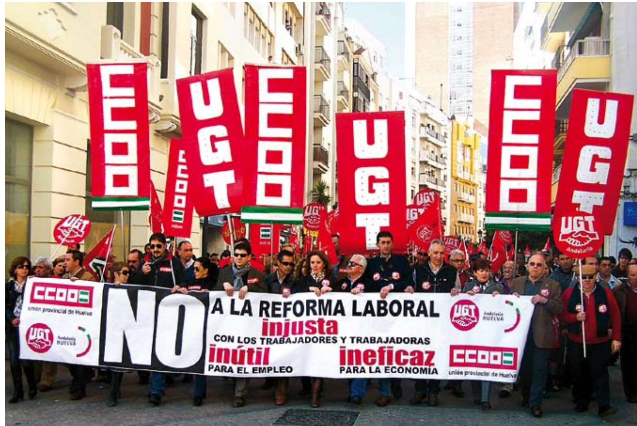
Protesta contra la reforma laboral la tarde del 10 de febrero en Madrid.

En nuestra opinión, la "empresarización" de la negociación colectiva auspiciada por el Real Decreto pone en cuestión el principio de autonomía