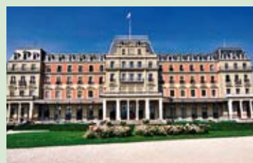
Palacio Wilson, Ginebra, sede del Consejo de Derechos Humanos de la ONU.

El Consejo de Derechos Humanos, creado por la Asamblea General de las Naciones Unidas el 15 de marzo de 2006 con el objetivo principal de considerar las situaciones de violaciones de los derechos humanos y hacer recomendaciones al respecto, forma parte del sistema de las Naciones Unidas y está compuesto por cuarenta y siete Estados Miembros responsables del fortalecimiento, la promoción y la protección de los derechos humanos en el mundo. El 18 de junio de 2007, el Consejo adoptó su "paquete de construc-