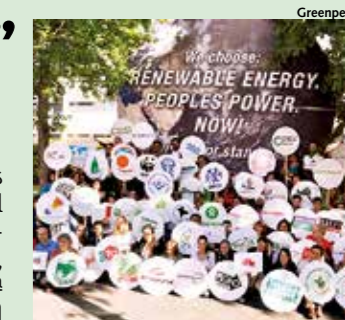
Miembros de grupos firmantes de "Volveremos".

El 21 de noviembre de 2013, diversas organizaciones de la sociedad civil internacional, como ONGs ambientalistas y movimientos sociales, abandonaron en Varsovia la 19ª Conferencia de las Partes (COP 19) de la Convención Marco de las Naciones Unidas sobre el Cambio Climático, en señal de protesta ante la falta de avances en las negociaciones y el escaso compromiso de los gobiernos. Esto nunca antes había sucedido en las reuniones de las Naciones Unidas.