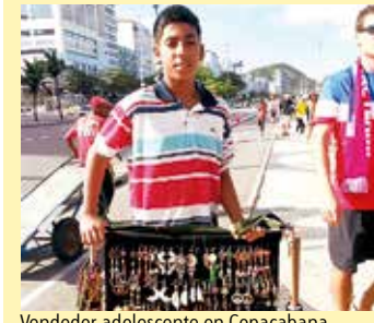
Vendedor adolescente en Copacabana.

* Director ejecutivo del Centro del Sur.